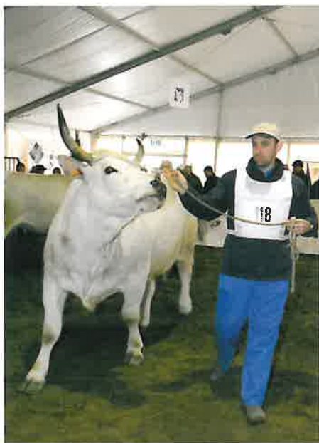
Nivea, vincitrice del Trofeo "Lucio Migni"