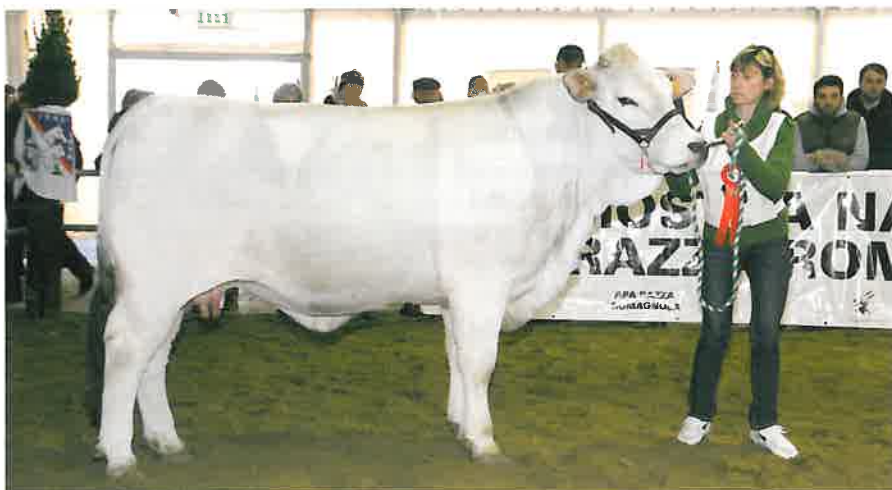
Primula delle Querce, Campionessa di Riserva Femmine Senior, All. Daga G. e A. - FC-