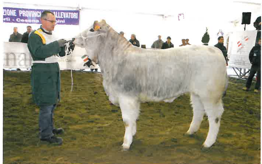
Vienna delle Querce, Campionessa di Riserva Femmine Junior, All. F.lli Verlicchi - RA-