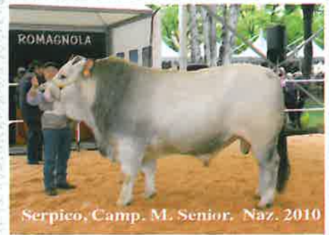
Serpico, Camp. M. Senior. Naz. 2010