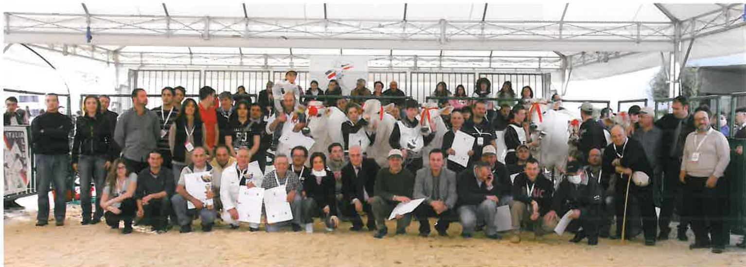
Gli allevatori - espositori della mostra