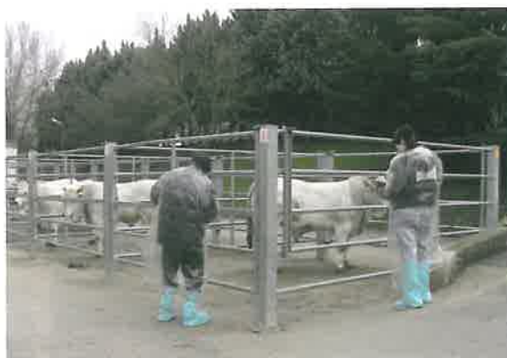
Gli esperti al lavoro.

zione oltre 1000 maschi delle cinque razze. I risultati degli aggiornamenti pratici, che prevedono anche una ulteriore sessione autunnale, verranno presentati e discussi, come di consueto, in occasione del prossimo incontro teorico invernale.