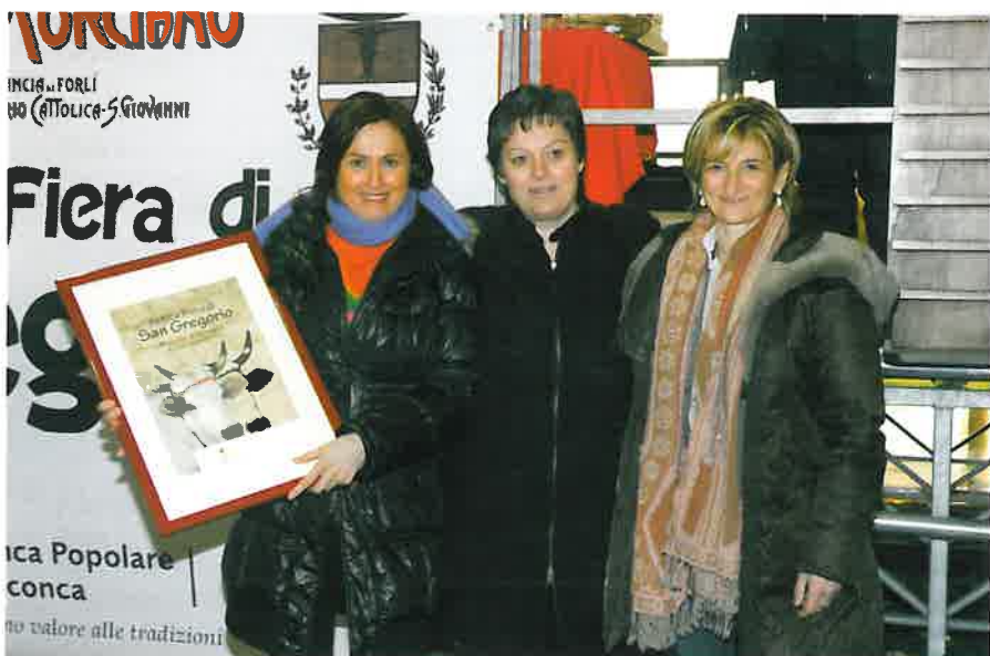
La consegna del quadro - ricordo da parte del Comune di Morciano.