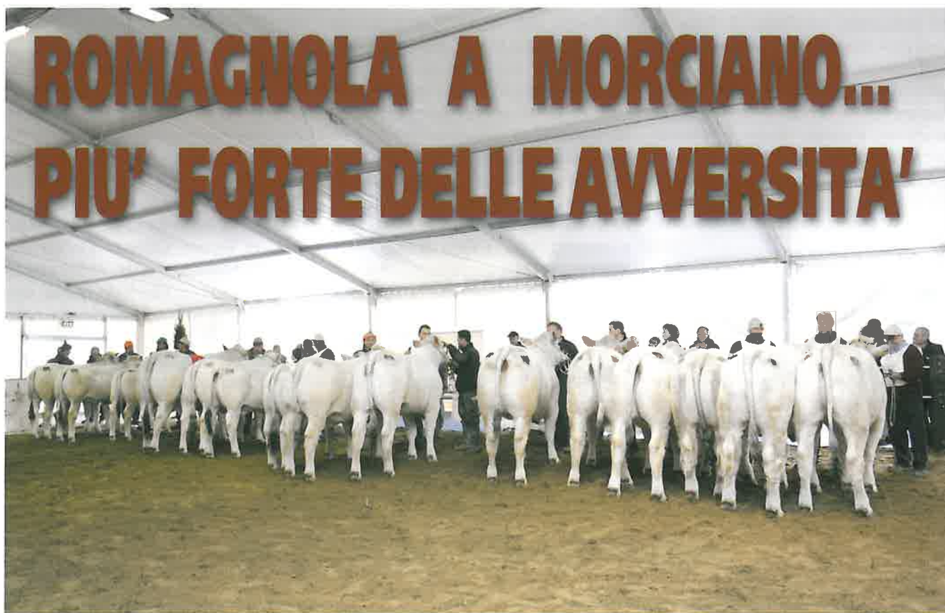
Il concorso "Gruppi di Allevamento"