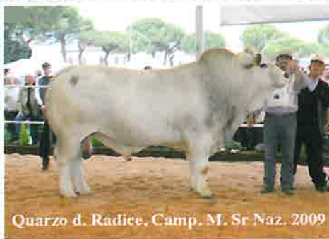
Quarzo d. Radice, Camp. M. Sr Naz. 2009