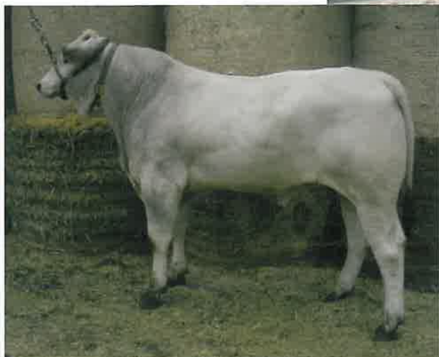
Vurco, razza chianina, All. F.lli Atanasi - PG

verranno stoccate come riserva genetica presso la banca Seme Anabic. Il recente acquisto di un mezzo per il trasporto dei vitelli in ingresso al centro genetico rappre-